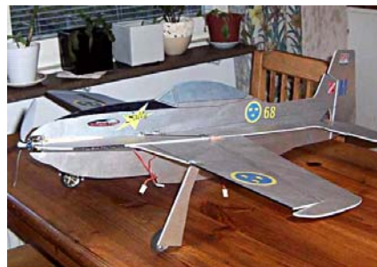
Magnus Östling, Mustang Sally www.svensktmodellflyg.se/ritningar.asp?plan=88