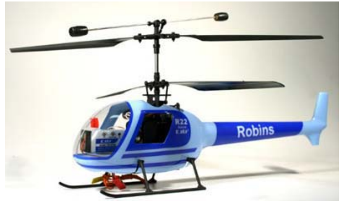
E-Sky Robins 22 http://www.muntration.se/shop/product_info.php?cPath=187&products_id=1006459