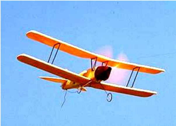
GWS Moth http://www.gws.com.tw/

Här nedan gör jag ett försök att illustrera de modeller Roger rekommenderar: