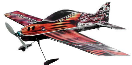
Wizard 2 från Autopartner, en firma i Eskilstuna http://www.autopartner.se