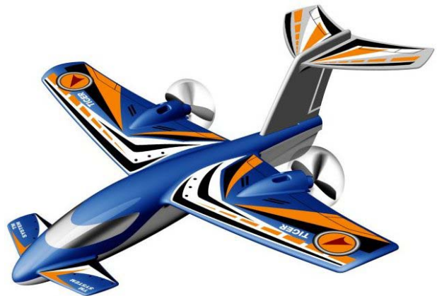
Silverlit, X-Twin http://www.teknikmagasinet.se/