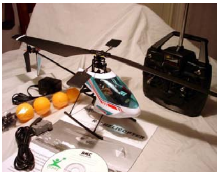
T-Rex 450 http://goldfeeling.com/4sale/heli/index.htm